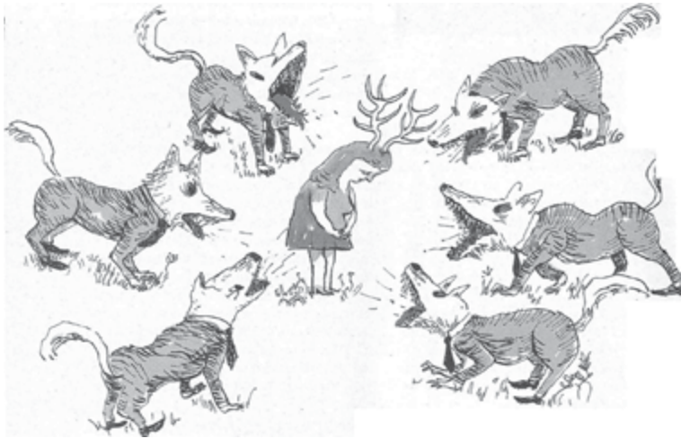
Ilustración de Alberto Vázquez.

Nueve y cuarto de la mañana en las oficinas centrales de una importante empresa. Comienza la reunión trimestral de ventas. El director comercial se dirige a su equipo. Pinta un retrato catastrófico de la situación: un mercado en recesión, aumento vertiginoso de las devoluciones, una ratio de morosidad importante... Seguidamente plantea los objetivos del trimestre, que pasan por un crecimiento de dos dígitos. Las caras de desánimo de los vendedores